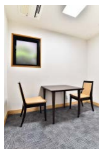
●階司式者控室 ご家族の方や、僧侶の控室として ご利用いただけます。