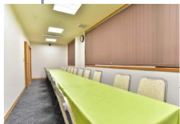
●1階控室 会食にご利用いただけます。 (22席)