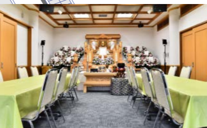
●1階ホール内 約25席 1階のみのご利用も可能です。 ※祭壇前で会食をする場合は16名様まで可能です。