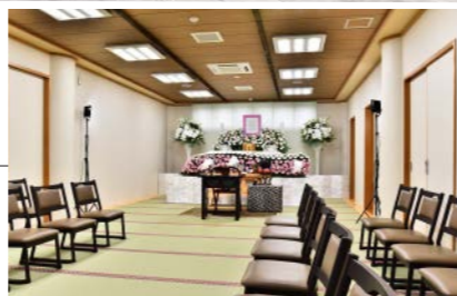
●2階和室(36畳) 32席 ※2階のみのご利用も可能です。 ※祭壇は料金に含まれません。 ※放送設備はありません。