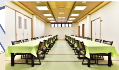
●2階和室(36畳) 約48席 祭壇を飾った場合は32名様まで 会食ができます。 ※仮眠される方の入浴施設も完備 しております。