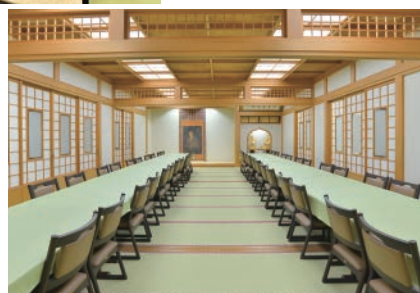
●客殿1階(39畳)約60席 仮眠にご利用いただけます。