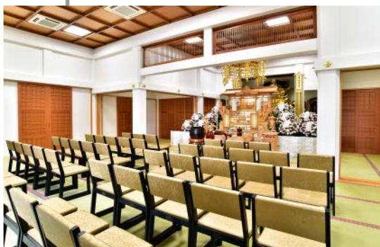
●本堂(36畳)約60席 ※祭壇は料金に含まれません。