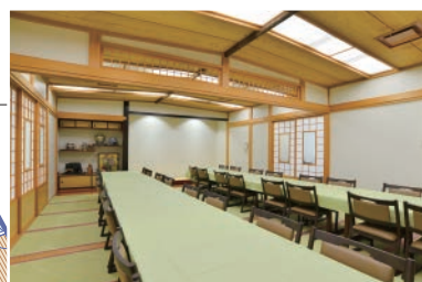
●客殿2階(24畳)約36席 (ご利用の際は別途料金がかかります。)