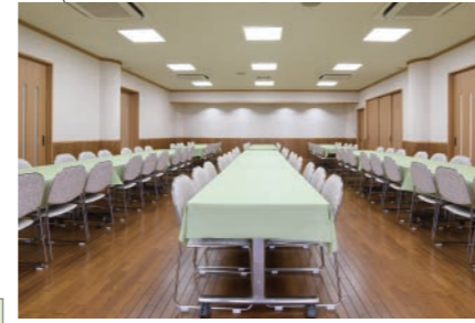
●2階大広間(48畳相当)84席 隣の「和室(20畳)」をつなげてのご利用も可能です。 ※立食(約120名様)でのご利用も可能です。