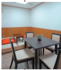
●1階控室 ご家族の方や、僧侶の控室としてご利用いただけます。