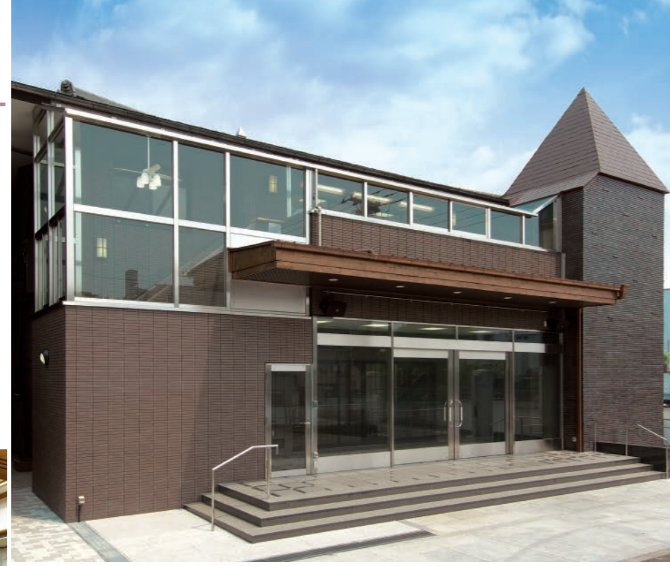
●むさしの齋場全景